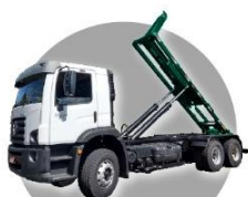
ROLL ON ROLL OFF